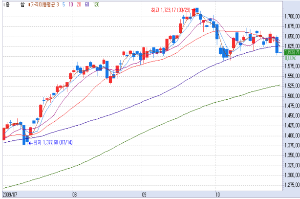
[그림3] KOSPI 60일 이평선 붕괴