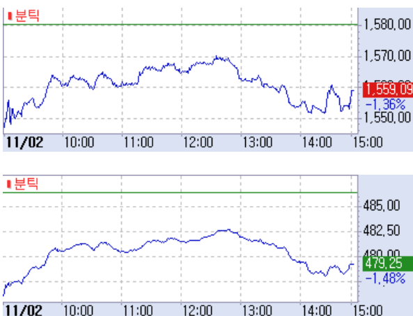
[그림1] 2일 KOSPI(上) 및 KOSDAQ(下) 일종흐름(분타기준)

일반전기, 컴퓨터서비스, 음식료, 건설 등의 하락세가 상대적으로 크게 나타남